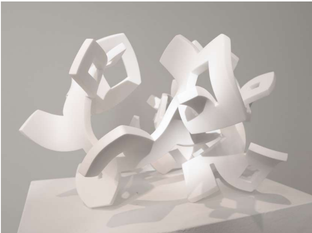
Windows - (2020) - Solid Surface - Dimensiones: 55 x 40 x 35 cm