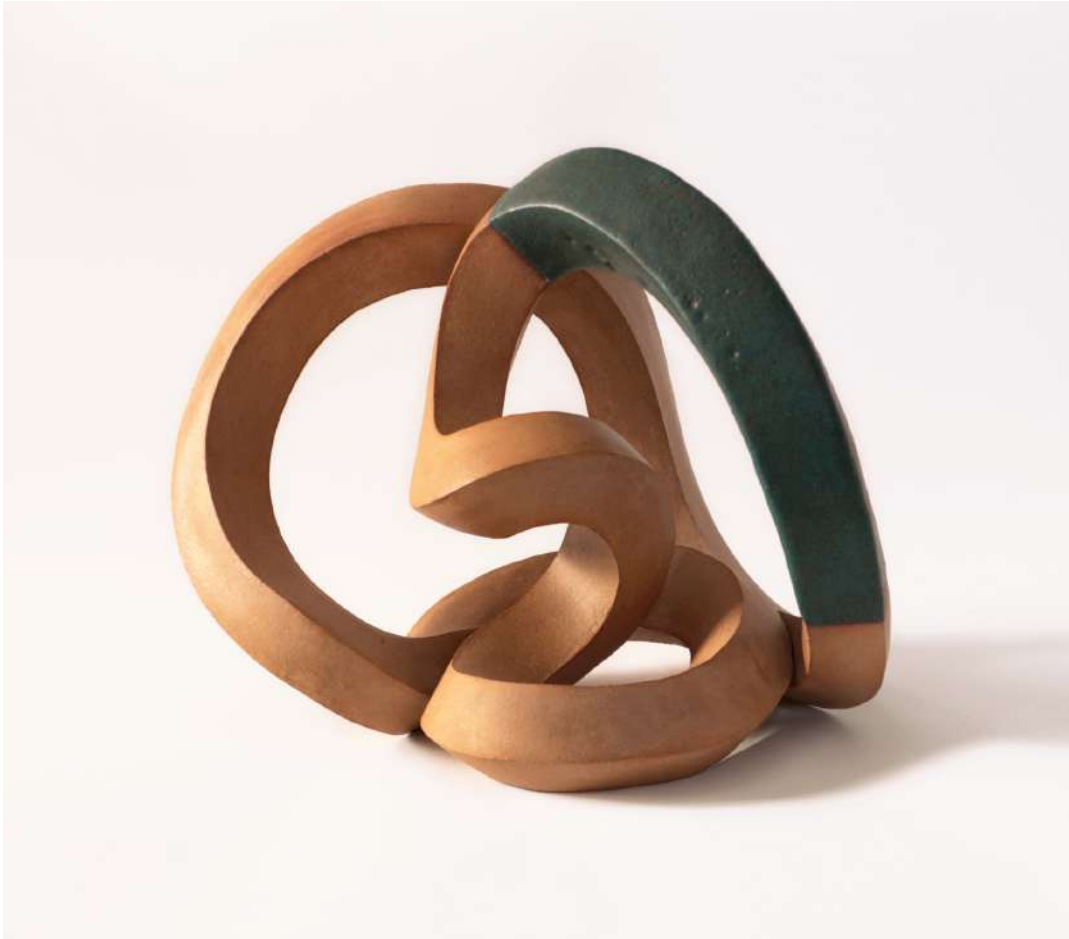
Curve 15 - (2023) - Dimensiones: 27 x 24 x 23 cm