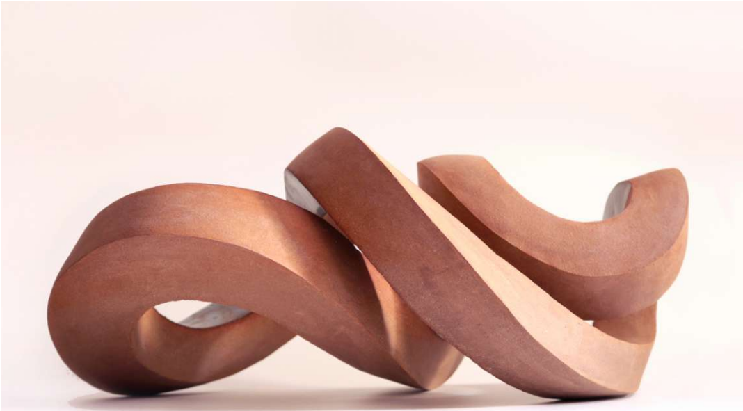
Curve 10 - (2022) - Dimensiones: 30 x 20 x 15 cm