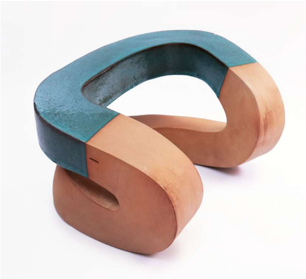
Curve 6 - (2022) - Dimensiones: 38 x 48 x 27 cm