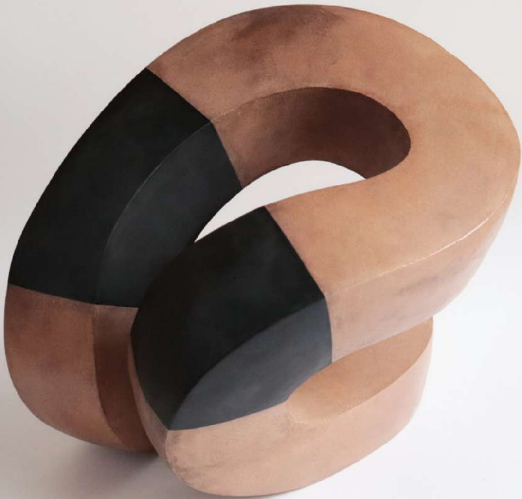
Curve 4 - (2022) Dimensiones: 32 x 32 x 34 cm

Comencé hace 6 años a trabajar en una nueva línea usando diferentes tipos de gres chamotado, creando recetas propias, mezclando el barro con ciertas fibras naturales para aumentar su resistencia y dar vida a piezas medianas que desafían la gravedad, el equilibrio y los contrapesos.