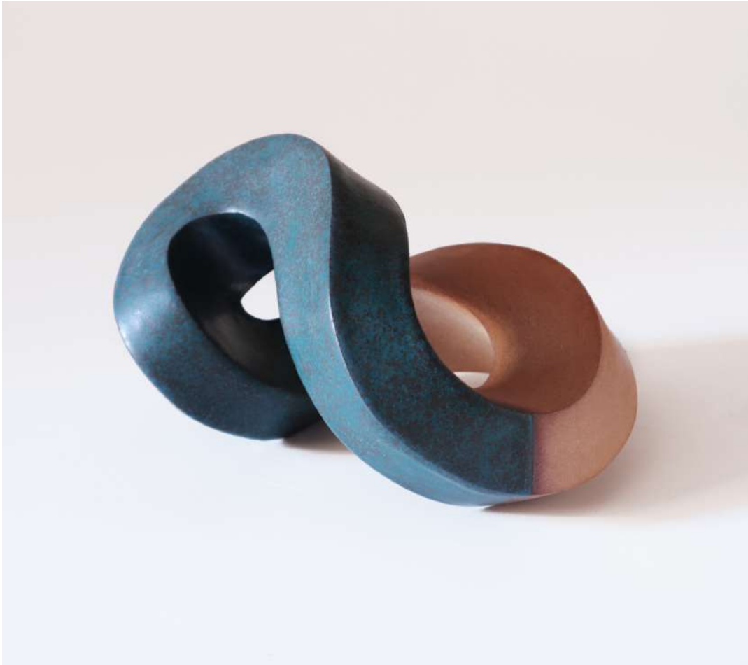
Curve 16 - (2023) - Dimensiones: 23 x 16 x 13 cm