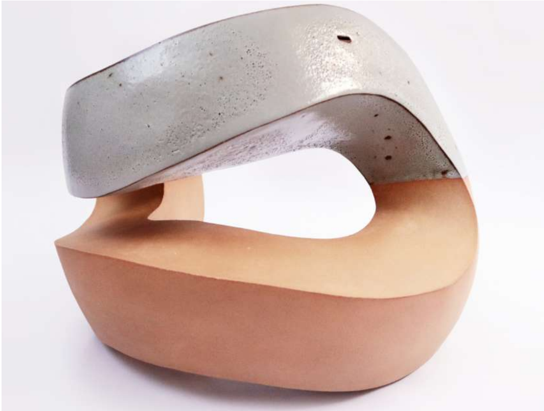
Curve 7 - (2022) - Dimensiones: 29 x 37 x 27 cm