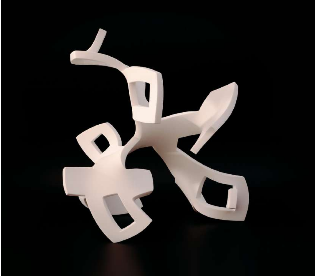
Embrassée - (2023) - Solid Surface - Dimensiones: 39 x 38 x 26 cm