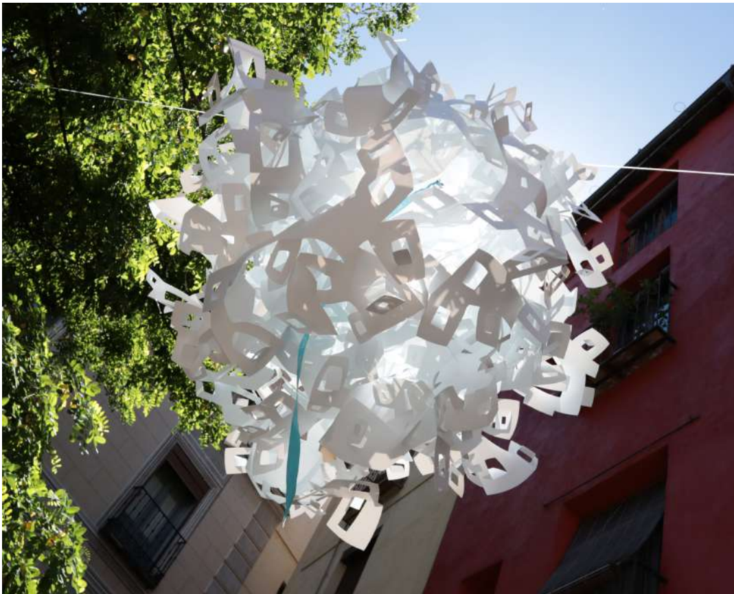
Amor Suspendido - (2019) - Poliuretano - Dimensiones: 180 x 180 x 180 cm