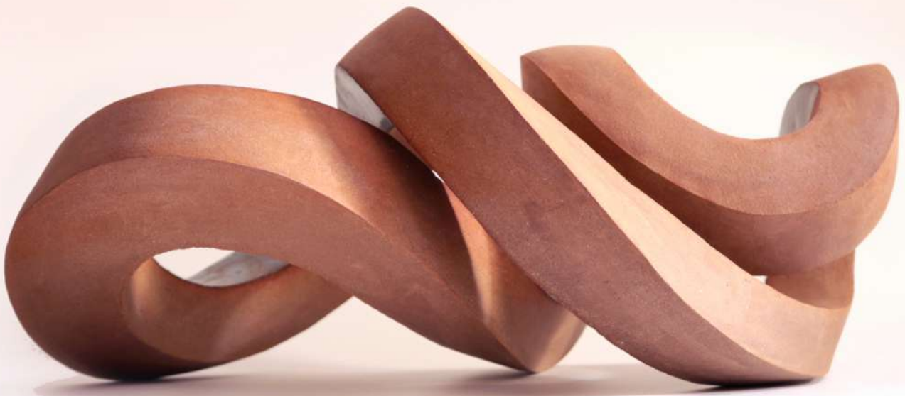
Curve 10 - (2022) - Dimensiones: 30 x 20 x 15 cm

Intento doblar y torcer la monotonía de la línea recta donde el equilibrio y las tensiones puedan ver nacer una carga emocional simbólica. Es a través de este juego que desarrollo piezas abstractas con un acabado liso, bruñido para resaltar los cantos y definir con precisión la línea general. Doy uso al barro por su conexión clara con la tierra y nuestras raíces, la línea cerrada con sus giros y cambios constantes como representación de la vida, el esmalte marcando etapas y cristalizando momentos concretos. Es con este vocabulario que busco en cada pieza un objeto de contemplación y de meditación que se pueda manipular y servir de apoyo a un momento introspectivo.