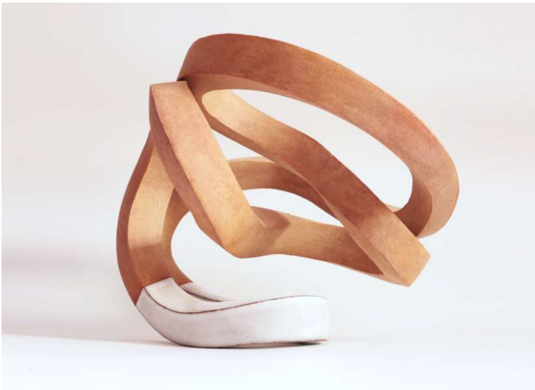
Curve 12 - (2022) - Dimensiones: 31 x 27 x 25 cm