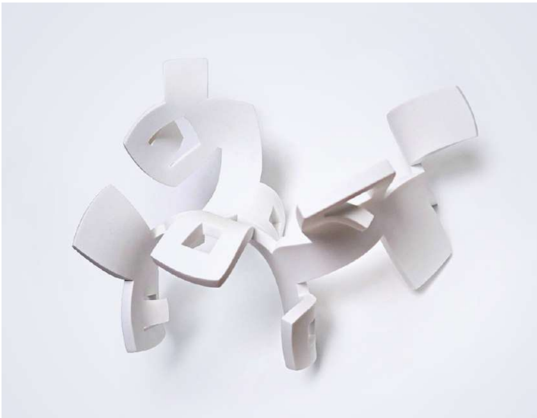
En Dansant - (2021) - Solid Surface - Dimensiones: 45 x 40 x 26 cm