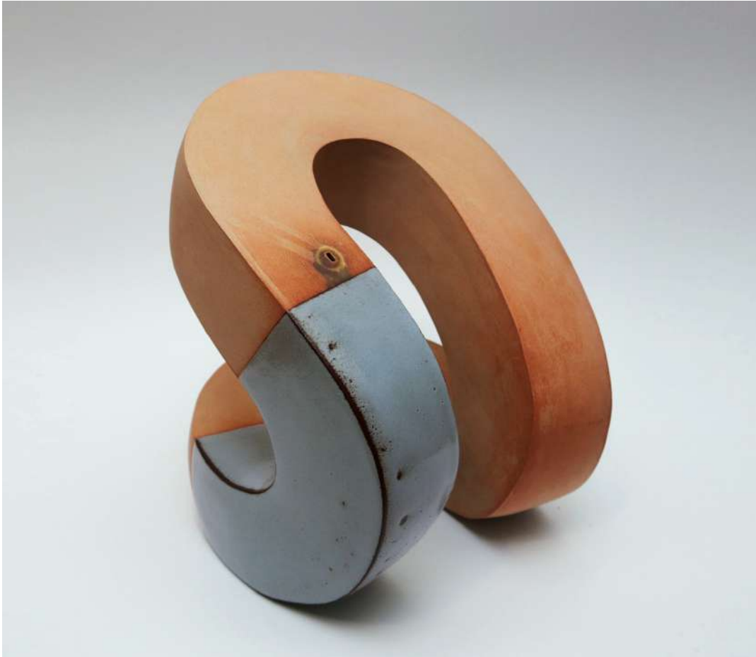
Curve 1 - (2021) - Dimensiones: 32 x 36 x 27 cm