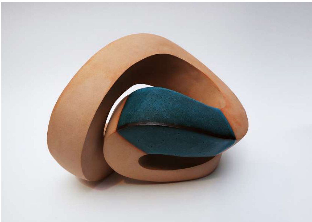
Curve 3 - (2021) - Dimensiones: 27 x 22 x 25 cm