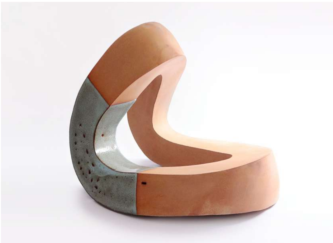
Curve 8 - (2022) - Dimensiones: 38 x 48 x 40 cm