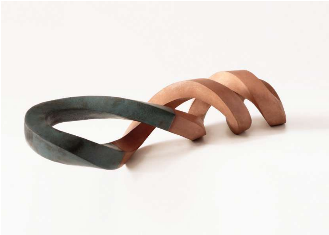
Girovague 1 - (2023) - Dimensiones: 55 x 19 x 13 cm