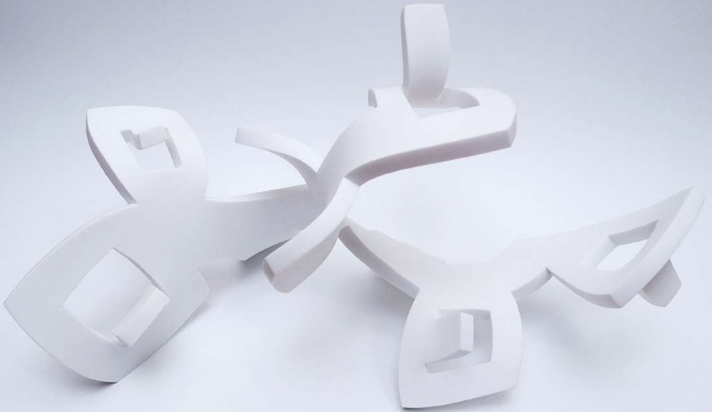
Sweet Wave - (2021) - Dimensiones: 50 x 30 x 30 cm

Tras haber investigado las posibilidades sobre papel decidí buscar un material más resistente para reforzar esta contradicción con lo que puede ser la danza. Encontré en las características del solid surface la posibilidad de trabajarlo a mano, recortando y termoformando con el uso de hornos industriales, acabando el proceso con la cristalización del material durante su enfriamiento. Es a partir de un trabajo previo que voy creando las etapas y los pasos para estructurar una coreografía incluyendo dibujo, recortes, creación de maquetas y prototipos en papel como una especie de origami para formar una escultura. Cada coreografía debe durar un máximo de cinco minutos, tiempo que me permite repetir los gestos y los pasos aprendidos previamente antes de que se enfríe el material. Mientras la coreografía se desarrolla, la pieza va tomando vida.