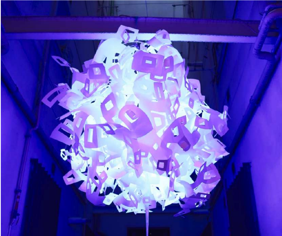
Light Up - (2021) - Poliuretano - Dimensiones: 200 x 200 x 200 cm